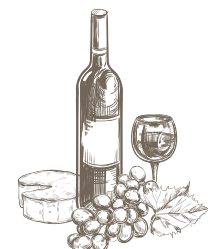
Planche apéritive (2 personnes) ..... 25 €

Une exclusivité pour les Pavillons de La Libellule, la formule comprend apéritif, baguette française, fromages locaux et « découverte » avec tapenades maison, fruits frais et fruits secs etc., ainsi qu'une bouteille de vin rouge.